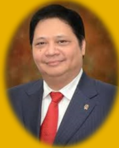
Airlangga Hartarto * Menteri Koordinator Bidang Perekonomian RI